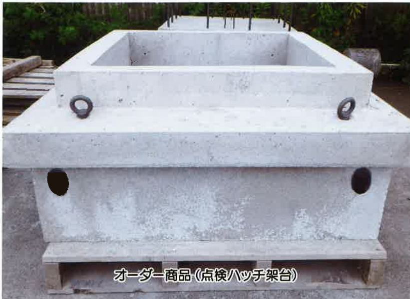
オーダー商品 (点検ハッチ架台)