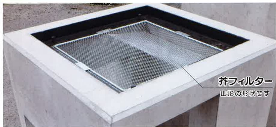
芥フィルター 山形の形状です