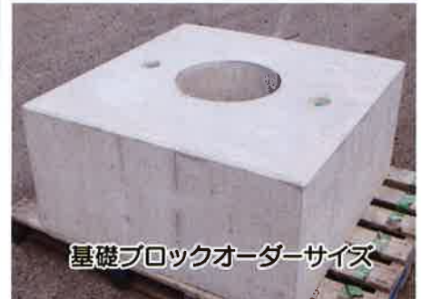
基礎ブロックオーダーサイズ